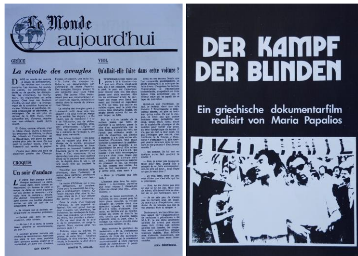
[Δημοσίευμα της “Le Monde”]

Τρία χρόνια μετά τη λήξη της κατάληψης του Οίκου Τυφλών και τη συμφωνία του Οκτώβρη '76, ολοκληρώνεται η διαδικασία δημοσιοποίησης και η μετατροπή του σε Κέντρο Εκπαίδευσης και Αποκατάστασης Τυφλών.